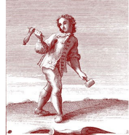
Grabado del libro Gabinetto Armonico